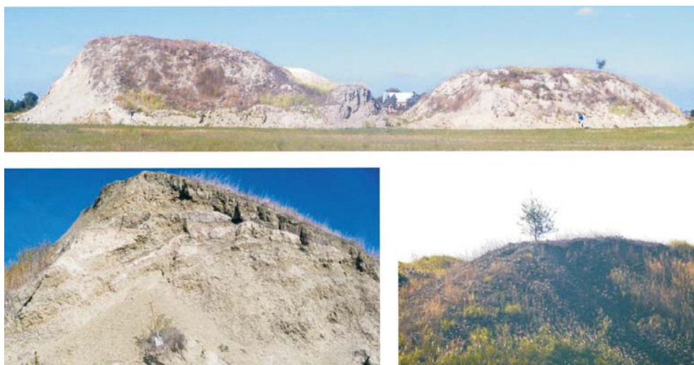
Rys. 6. Złoże antropogeniczne Janiszew – iły neogeńskie