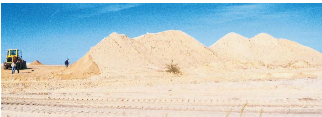
Rys. 7. Złoże antropogeniczne Władysławów – piaski i żwiry czwartorzędowe

W latach 2005–2009 przy odkrywce Władysławów odkładano piaski i żwiry głównie na potrzeby budowanej w pobliżu autostrady A-2. W tym czasie wydobyto ponad 200 tys. m 3 piasków i żwirów. Kruszywo piaszczysto-żwirowe było równocześnie składowane na zwałach i sprzedawane. W efekcie na koniec 2009 roku w jednym zwale pozostało blisko 12 tys. m 3 piasków i żwirów. Zwał ten, jako złoże antropogeniczne Władysławów, przetrwał do połowy 2012 roku, kiedy go sprzedano. W czasie badań terenowych (IX 2012 roku) kruszywo z omawianego złoża było eksploatowane, a następnie wykorzystywane do produkcji betonu (rys. 7).