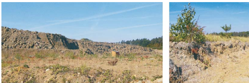
Rys. 4. Złoże antropogeniczne Kleczew – iły neogeńskie

W uśrednionym składzie mineralnym ilów nadkładowych z konińskich odkrywek, w tym z odkrywki Kazimierz N i Pątnów, dominuje smektyt (beidelit) – ~60%. Ponadto współwystępują z nim następujące minerały: illit – ~10%, kaolinit – ~6% i kwarc – ~24%. Natomiast przedziały zmienności uziarnienia omawianych ilów są następujące: frakcja ilasta – 37–64%, frakcja pylasta – 5–40% i frakcja piaszczysta – 10–20% (np. Gradecki 1997). Warto też wspomnieć, że w wielu próbkach przekroczona jest dopuszczalna zawartość węglanów (margla) i siarczanów (gipsu). Niemniej jednak w wyniku składowania margiel i gips częściowo ulegają rozkładowi, co poprawia jakość surowca przeznaczonego