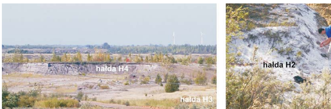
Rys. 3. Złoże antropogeniczne Honoratka – piaski i ropy neogeńskie