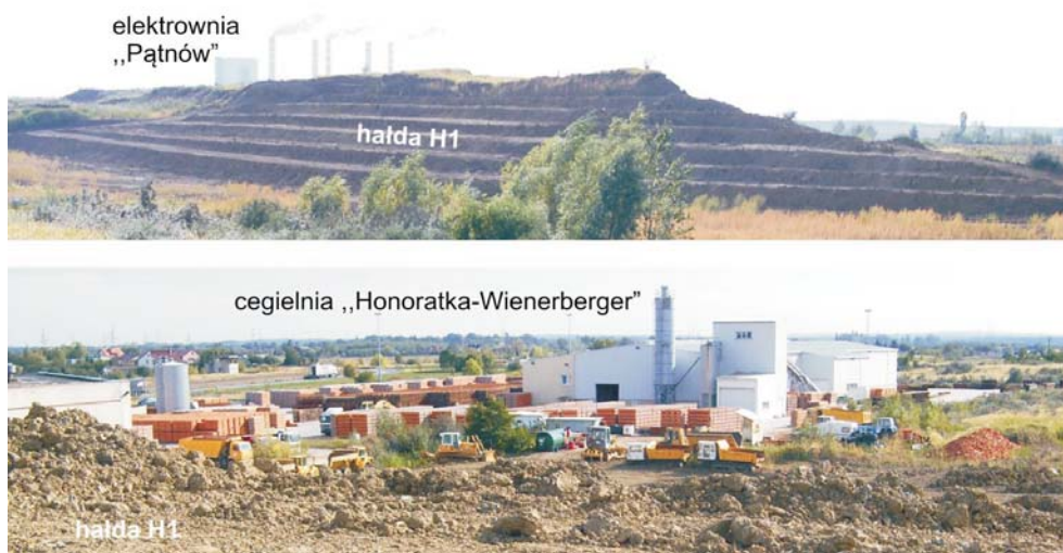
Rys. 2. Złoże antropogeniczne Honoratka – ropy neogeńskie

Łącznie w złożu antropogenicznym Honoratka, w ciągu 25 lat jego istnienia, odłożono około 4,1 mln m 3 neogeńskich kopalin. Z tego ropy nadwęglowe stanowiły blisko 3,0 mln m 3 ,